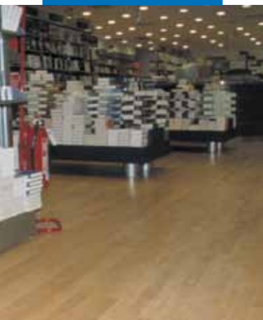
Beispiel einer Fertigparkettverlegung auf einem mit Ultraplan ausgeglichenen Untergrund. Messaggerie Musicali - Rom - Italien