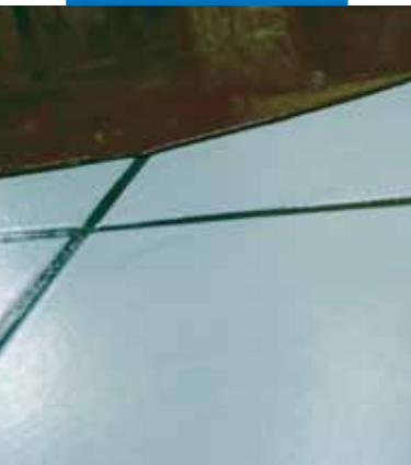
Detail zur Verarbeitung von Ultraplan auf dem vorab grundierten Keramikbelag