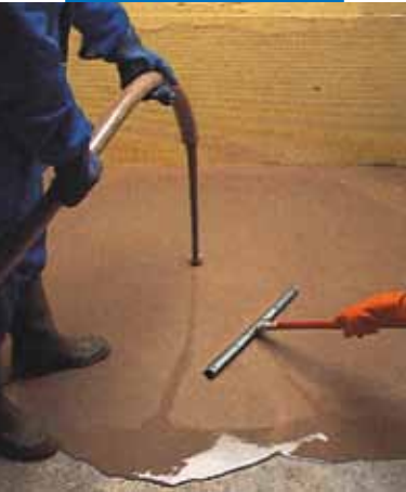
Maschinelles Verarbeiten von Ultraplan