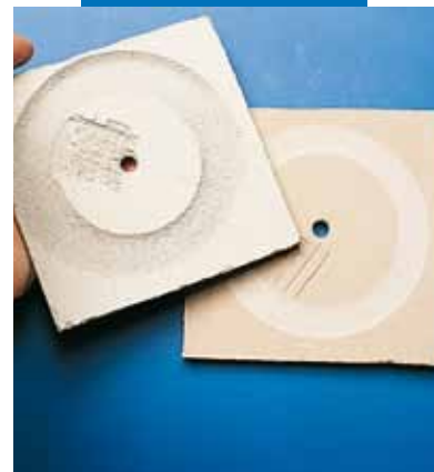
Prüfung des Verschleissverhaltens (Taber) nach 200 Umdrehungen auf Ultraplan (rechts) und auf herkömmlicher Bodenspachtelmasse

Stuhlrollen: geeignet (Rollen gemäß EN 12529)