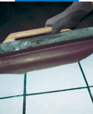
Verarbeitung von Ultraplan mittels Glättkelle auf vorhandenem Keramikbelag nach vorheriger Grundierung