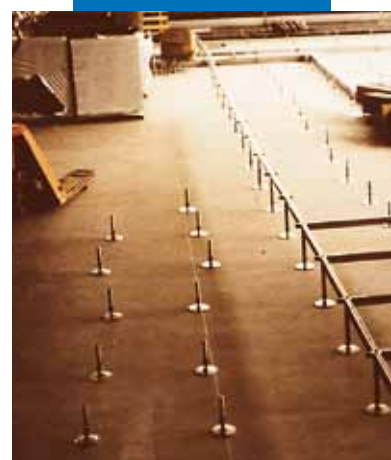
Ausgleich von Unebenheiten einer Betondecke vor der Herstellung eines Doppelbodensystems