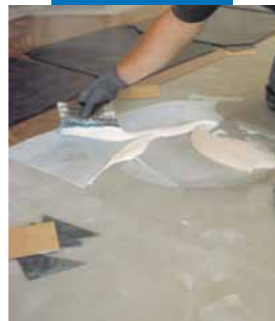
Beispiel einer PVC-Intarsienverlegung auf Ultraplan. CD2 - Mailand – Italien